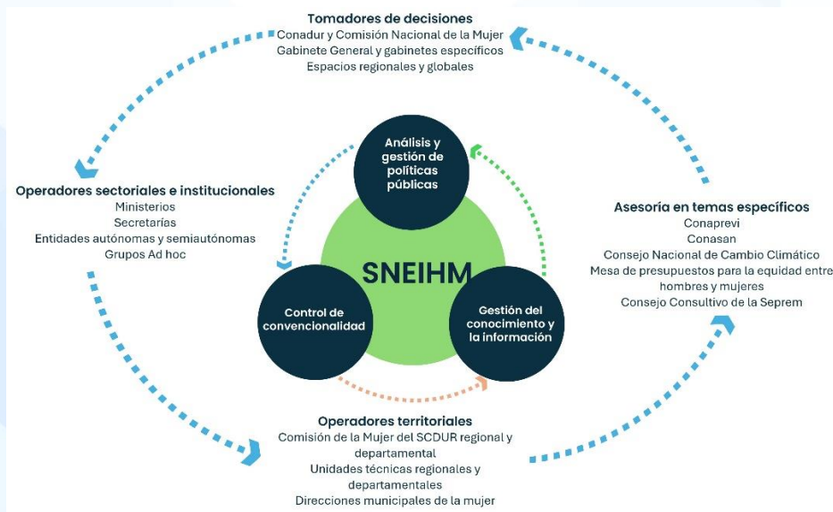
Figura 1. Esquema del SNEIHM

El SNEIHM, con el desarrollo e implementación de herramientas técnicas y metodológicas, constituye la forma de coordinar, orientar y asesorar la gestión interinstitucional con el SNP, en términos de control de convencionalidad, políticas públicas, gestión sectorial, gestión territorial y gestión del conocimiento y la información, para orientar la toma de decisiones, respecto de la oferta programática y el presupuesto.